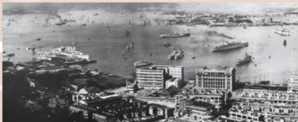
40年代灣仔海傍

1941年，香港通過《1941年戰時稅收條例》，加入徵收利息稅的條文。1941年12月8日，香港受襲，戰稅亦停止徵收。