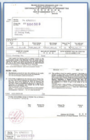
稅務局在收到借貸人繳付的利息稅後會發出「利息稅扣稅證明書」