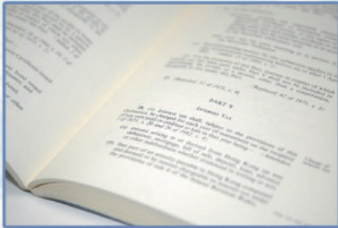
《稅務條例》下有關利息稅的條文(已廢除)