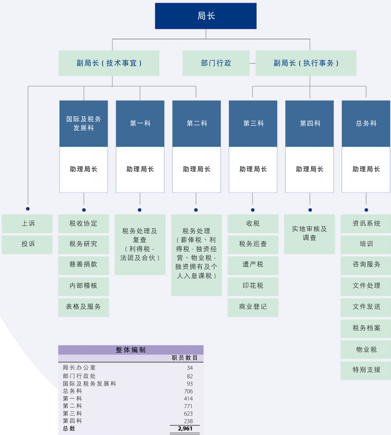
税务局组织图（在 2024 年 3 月 31 日）